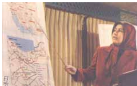
En representant for MKO peker ut bombemål for USA i Iran.