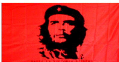
Plakat til salgs hos NKP.