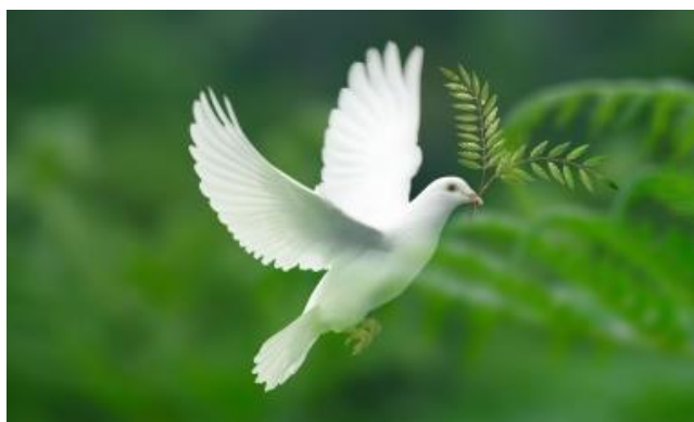
Arbeid for fred er viktigste i dag.