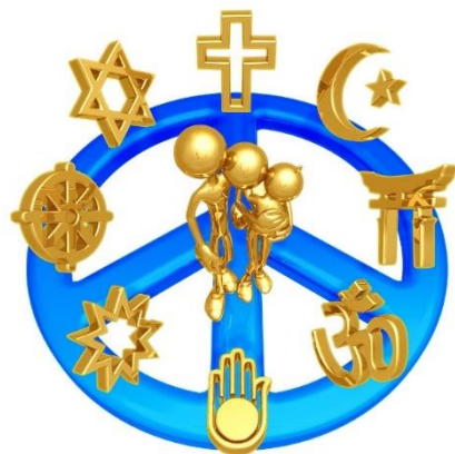
Enhetlige tanker fra Malcolm X.