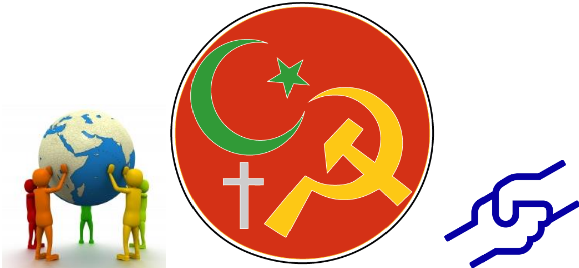
Foreningen Muslimer og kommunister

Ved valget: Stem NKP Norges kommunistiske parti