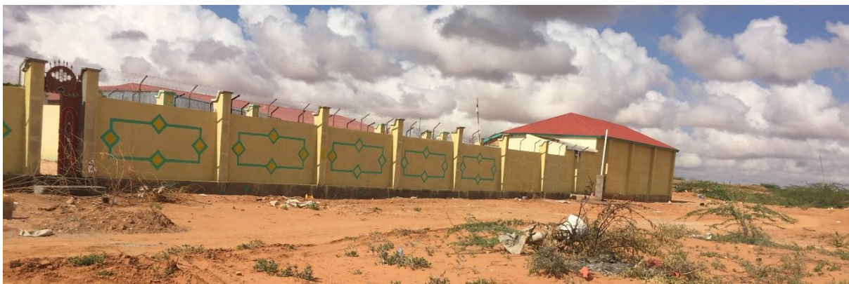
Barnehjemmet – et godt sted å være.