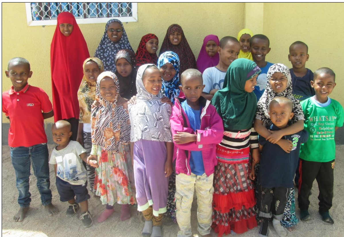
Gode venner på hjemmet.