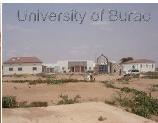
Noen eldre barn/ungdommer til Burao Academy. Enkelte kan drømme om universitetet.