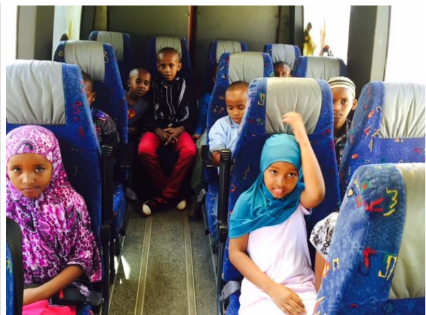
Med skolebussen på tur.