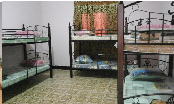
Urtehagen med leid hus – omgjort til barnehjem.