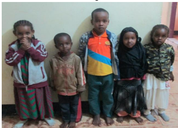
Foreldreløse/fattige barn til barnehjemmet.