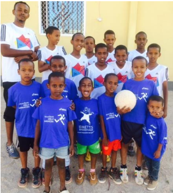
Guttene har godt fotballag.