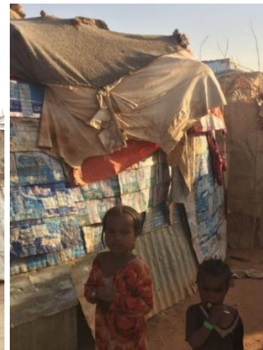
Hus og boliger, naboer til barnehjemmet.