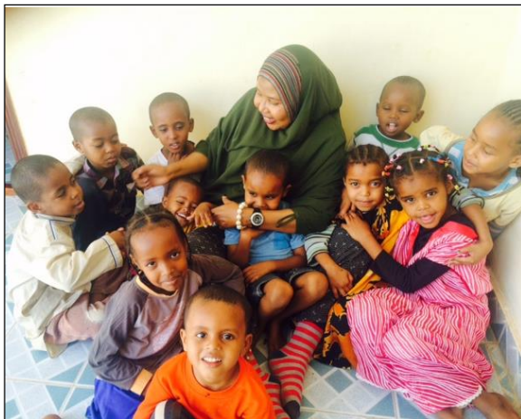
Fosiyo blant hyggelige barn.