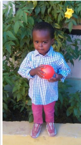
Ali er betenkt.