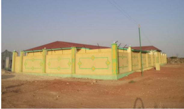
Urtehagens barnehjem i somalisk Burao.