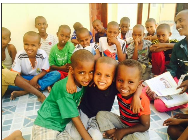
Hyggelig med blide fjes.