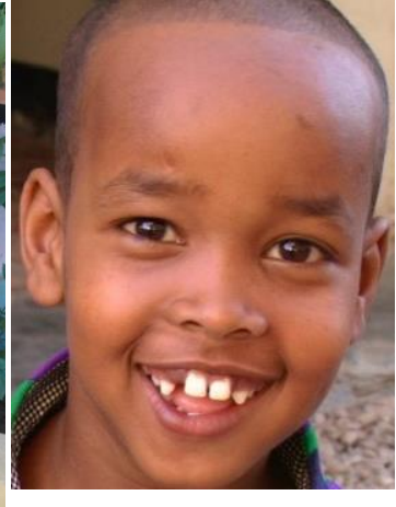
Et annet blidt fjes.