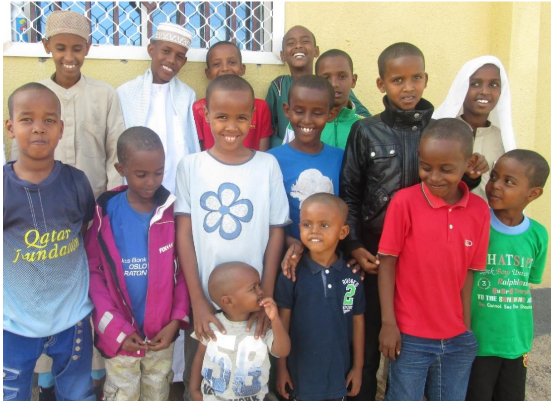
Lek og smil på barnehjemmet