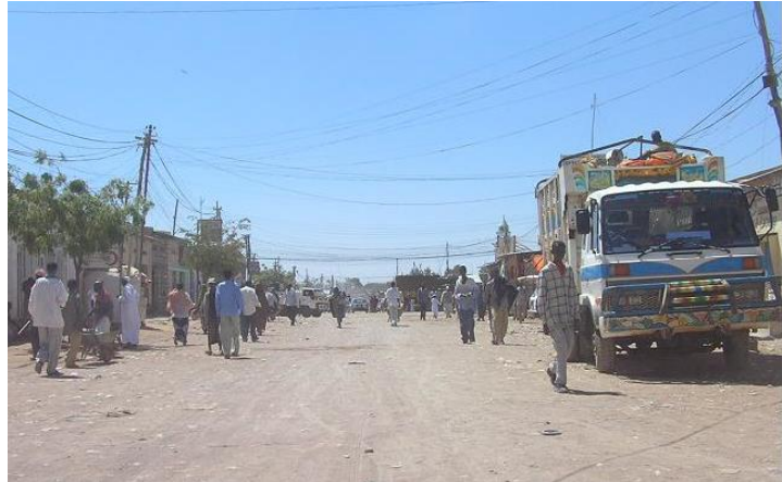
Urtehagen på Afrikas Horn – her i Burao.