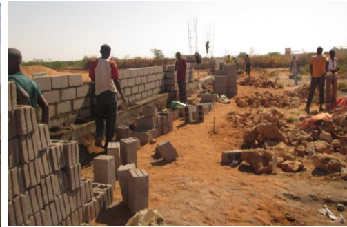
Byggearbeid på gang.