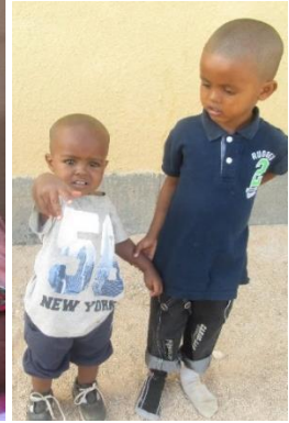
To barn ble funnet forlatte i et skur. De hadde ikke navn. Vi kalte dem Ali og Hamza.