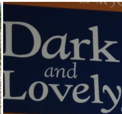
Mennesker, dyr og reklame i Burao.