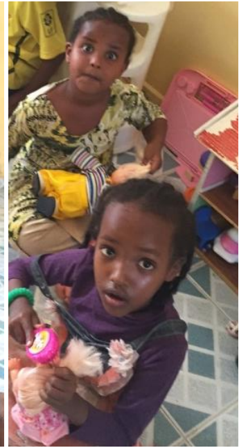
Felleskap og samvær