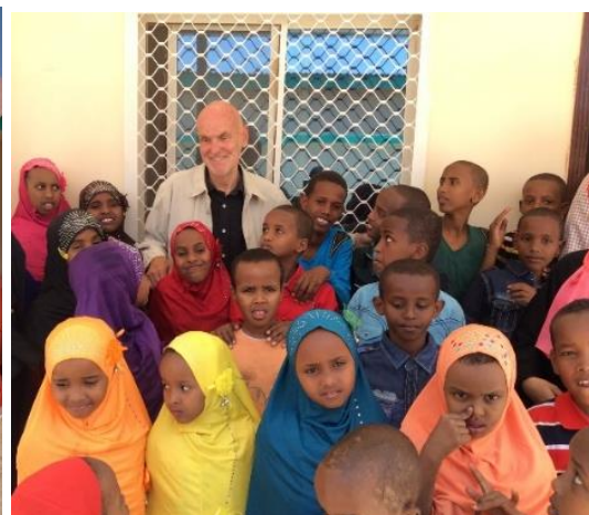
Urtehagens representant fra Oslo til stede.