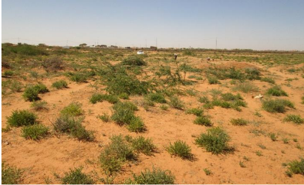
Dette er tomta litt utenfor byen.