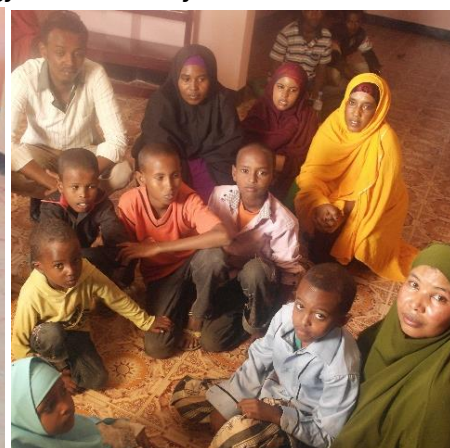
Barnehjemmet åpnet (2013).