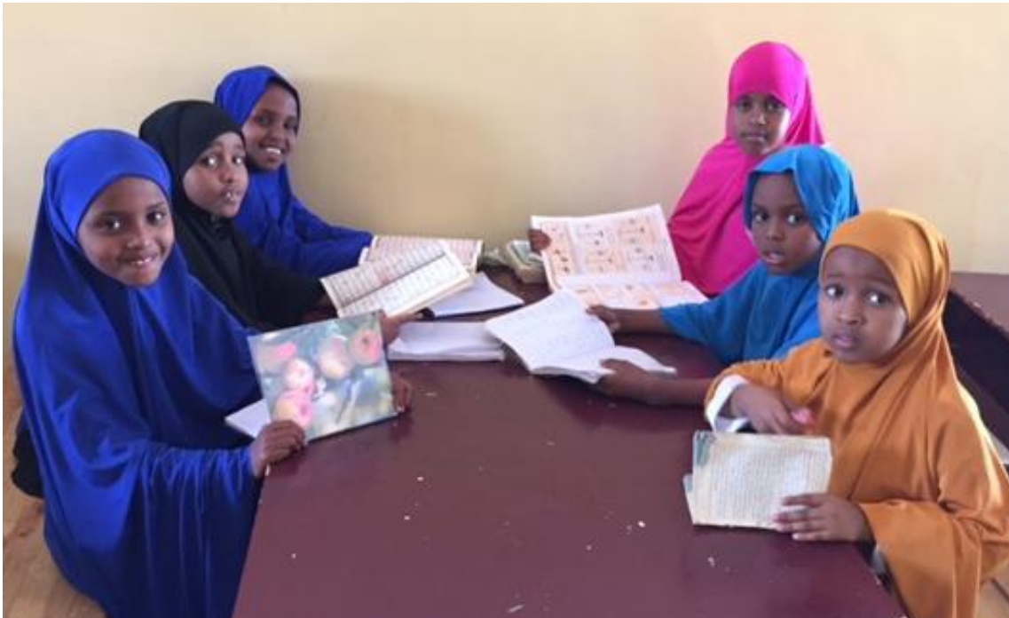
Hjemmelekser er viktig.