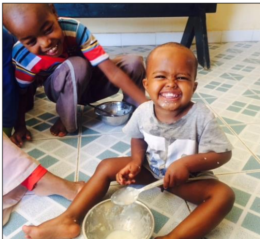
Ali er blitt stor.