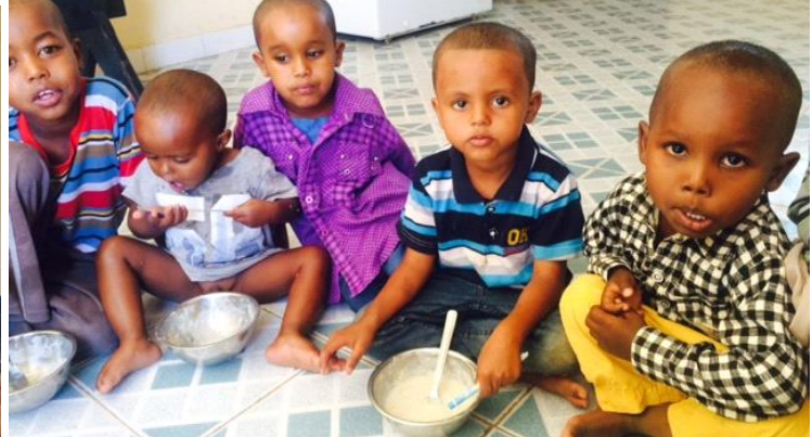
Barn får omsorg, mat og klær.