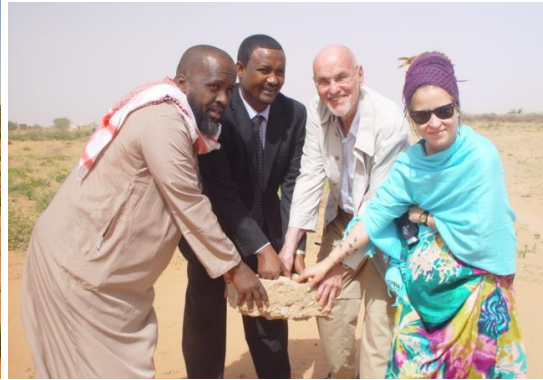
Grunnsteinen legges ned.