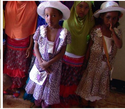
Nye barn får plass i barnehjemmet