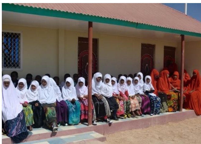
Barn kledd for fest til åpningen.