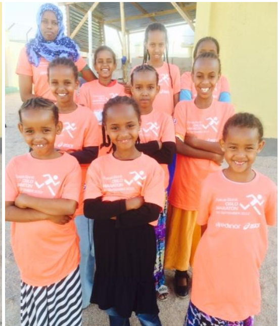
Det har jentene også.