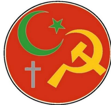
Foreningen Muslimer og kommunister.