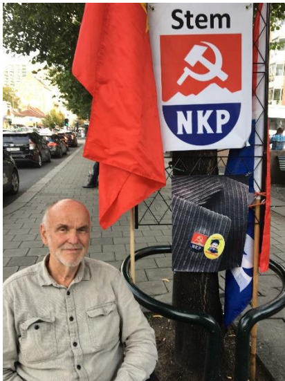
Artikkelforfatteren på valgstand.